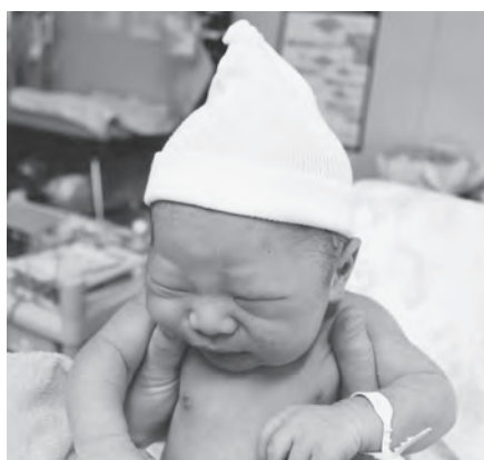
こんにちは 赤ちゃん

の導入を予定しており、オンラインでの育児相談も可能になるので、今まで以上に切れ目のない支援ができると考えている。今後もちょうじた取り組みで、0歳児とその家庭を見守っていく。