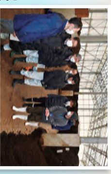
「あんしん堆肥 美郷の大地」生産中