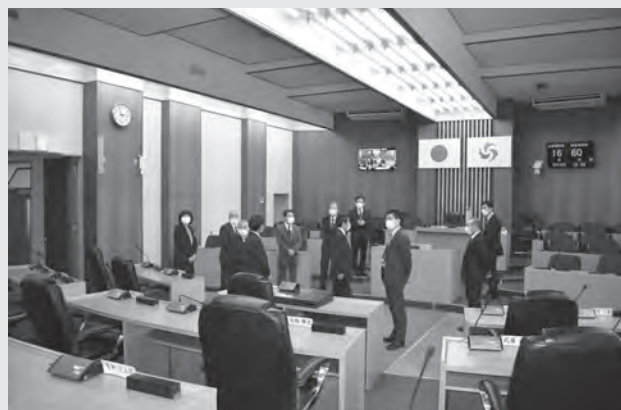
仙北市議会・議場

また、議会中継のネット配信については、時間を選ばず多くの町民に議会への関心を持ってもらうことができるなどの意見が出され、今後も調査・検討を進めていくこととした。