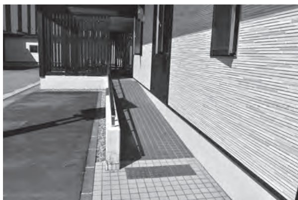
宿泊交流館ワクアスのスロープ

スロープは、中央ふれあい館と宿泊交流館に設置済みで、北・南ふれあい館は、令和5年度に関連予算を計上している。