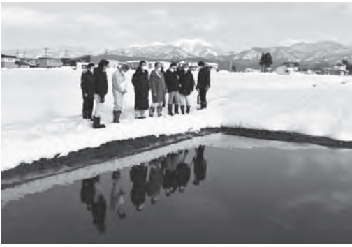
新しい涵養池を視察