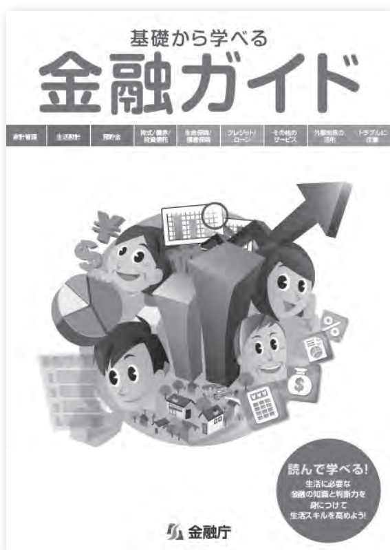
金融庁が作成した教育教材

金融政策」「グローバル経済と金融」について学習している。家庭科では、「消費者としての自覚」「購入方法と支払方法」「バランスよく計画的な金銭の管理」について学習し、その中の「未成年者の契約」のところで、契約を取り消すことができる場合などについても学んでいる。 金融教育において、お金や金融のさまざまな働きを理解することによって、生活における経済面での行動判断を適切に行えるようにし、各種被害に遭わないようにする力の育成を目指している。