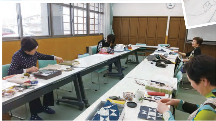
つつし飾り、刺し子、パッチワークなど自由に手作り