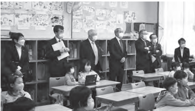
電子黒板・タブレットを使用した授業を視察

◇家庭での学習でもタブレットを利用できるように、持ち帰りのルールを定めてほしい。