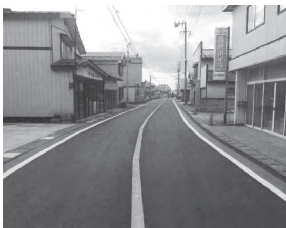
補修工事後の中央通り線