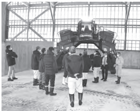
山積みの堆肥を上からかき混ぜる自走式攪拌機