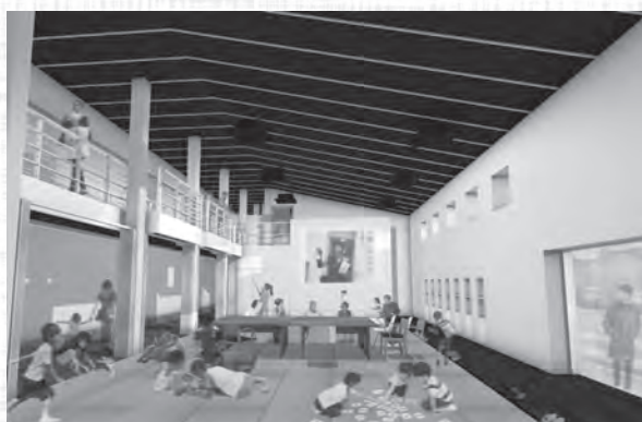
湧太郎完成イメージ図（現在の水文館）

商工観光交流課長 建物の長寿命化や機能強化という、過疎対策事業債を活用する際の要件に合致しない部分があり、一部を一般財源とした。