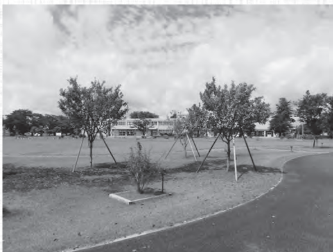
葉樹の森健康公園

農政課長 「生菓の里美郷」構想を策定して10年が経過し、「葉樹の森健康公園」はそのシンボル拠点であることから、連携企業を対象にパートナーを募集する。ネーミングライツは、自治体の経済的負担を減らし、企業側は宣伝効果を高められ、イメージの向上につながる。