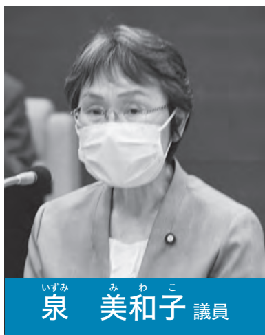
いずみ みわこ 議員 泉 美和子