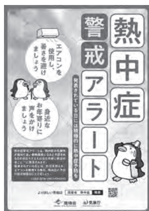
環境省作成のポスター

町長 エアコン点検等の勧奨については、介護予防教室等でパンフレットを配布し、啓発している。町広報の特集記事でも注意喚起を行う。