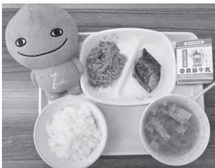
町内小中学校に提供のサキホコレ給食

町による県立高校への給食提供の実現には、たくさん課題があり、調査・研究したい。その上で、町としてどのような支援が望ましいかを見極め、考えていく。