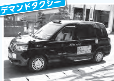
料金400円、電話等で随時予約

龍角散の工場では、厚生棟の新築工事が進められていました。建物内部の仕上げ材には、美郷町産スギ材（約4トン）が使われています。