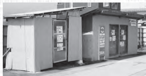
現在の六郷地区リサイクルステーション