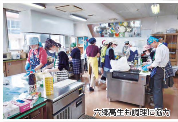
六郷高生も調理に協力