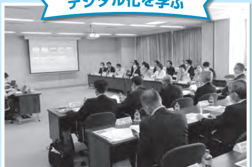
大田区の議員は、ペーパーレスで会議