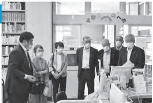
▲図書検索システムの操作を確認

館内の設備や蔵書の内容などを調査した。 ☆令和2年度に書籍消毒機、令和4年度に視聴覚コーナーを設置した。 ☆古くなった蔵書は、県立図書館や近隣の図書館とのバランスをとって除籍し、定期的に入れ替えしている。 ☆本の追加の要望には、ほぼ対応している。要望は、直接職員に話してもらうか、アンケート用紙に記入してもらっている。メールでもらうこともある。 ☆学校が長期休暇の時は利用者が増え、閲覧室・学習室のスペースが不足するため、中央ふれあい館の会議室を開放している。