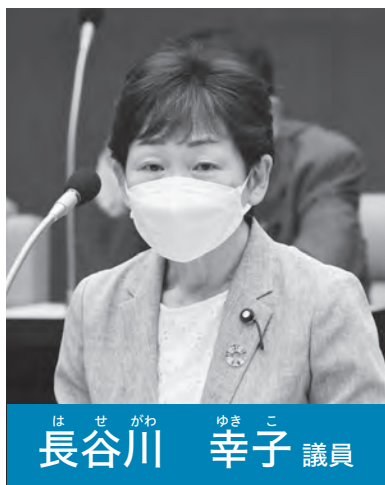
は せ がわ ゆき こ 長谷川 幸子 議員

議員 熱中症対応マニュアルの作成や「暑さ指数」の認知度向上など、熱中症に関する情報発信への取り組みは。