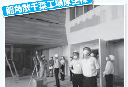
壁や天井には美郷町産スギ材