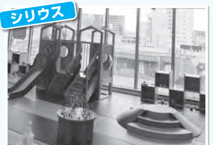
乳幼児対象の「ちびっこ広場」

「ASOBono!（アソボーノ）」（東京ドームシティ内）は、多くの自治体の子育て支援施設に関わる会社が運営しています。色々な遊具の中で、子どもたちが元気に遊んでいました。