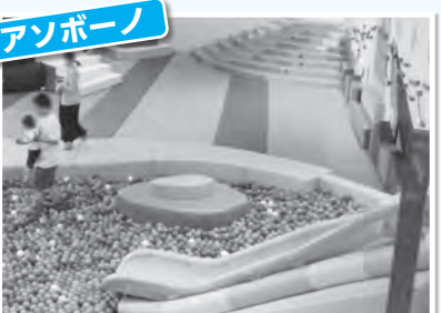
都内最大級のボールプール