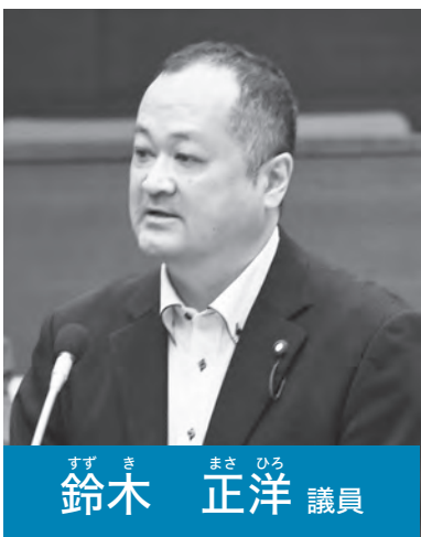
まさひろ まさき 議員 鈴木 正洋

勤勉手当は職員の勤務成績に応じて支給する主旨であり、人材確保の観点を踏まえた上で、支給の可否を判断していく。