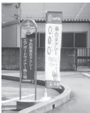
乗合タクシー 「ミズモシャトル」停車場(大曲駅)

議員 幅広い業種や地域住民が連携した観光地域づくりの充実にどう取り組むのか。 また、観光客の二次交通に関する新たな交通システムの構築についての考えは。 町長 地域資源活用協議会を中心に、幅広い業種の意見を共有し、地域全体として連携の取れた観光振興に努める。 新たな交通システムについては、現在取り組んでいる実証事業をもとに判断する。