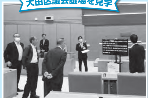
発言がすぐ文字化されるシステムを導入

他には、産業創出の拠点となる大規模複合施設「羽田イノベーションシティ」などを見学し、2日目からは、地域課題解決の先進地を委員会ごとに視察しました。