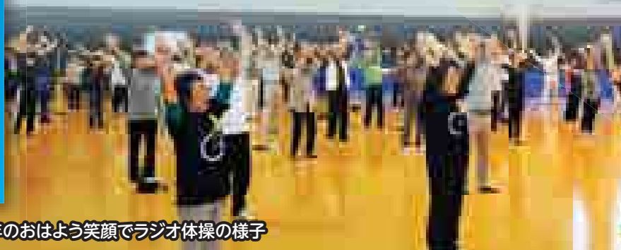
■昨年のおはよう笑顔でラジオ体操の様子

これらのイベント以外でも、いつも楽しんでいるスポーツや「農作業」「買い物」などで体を15分以上動かしていればOKです。チャレンジデーへの参加方法等については、5月15日に配布されるチラシをご覧ください。