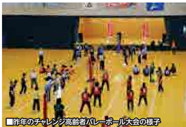
■昨年のチャレンジ高齢者バレーボール大会の様子